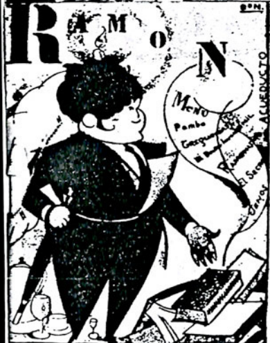
RAMÓN. Caricatura de Bon